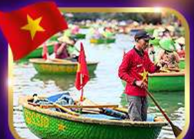
เรือกระด้ง หมู่บ้านกิมกาน