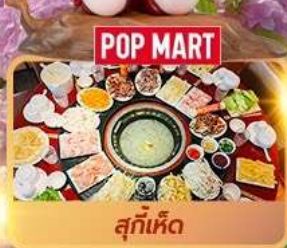
POP MART สุกี้เห็ด