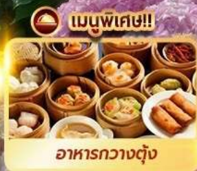
เมนูพิเศษ!! อาหารกวางตุ้ง