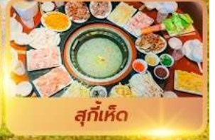
สุกี้เด็ด