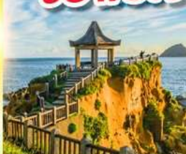
เกาะเหอผิง

พักย่านซีเหมินติง 2 คืน ขอพรเจ้าแม่กวนอิมพันมือ