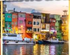
ท่าเรือประมงเจิ้งปิ่น