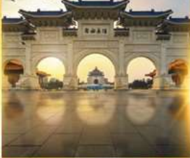
อนุสรณ์เจียงโคเซค