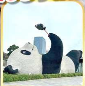
แพนด้าเซลฟี