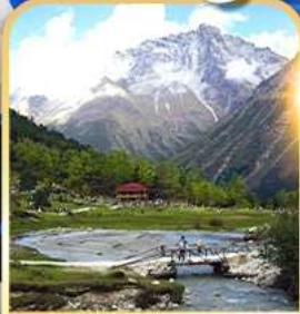
อุทยานปี้เฟิงโกว