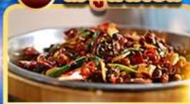
อาหารเสฉวน