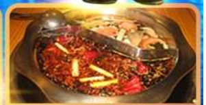
สุกี้ท้องถิ่น