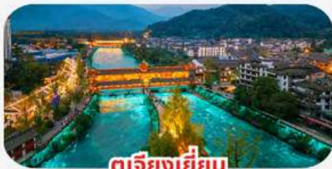
ตูเจียงเยี่ยน