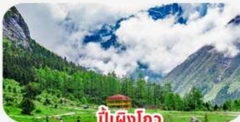
ปีเผิงโกว