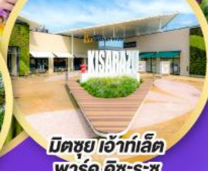
มิตซูเอะอิเกะ พาร์ค คิซะระชู