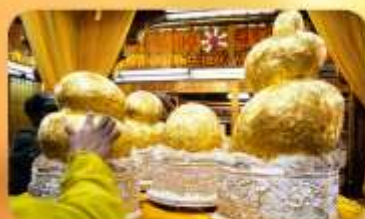
พระบิวเข้ม