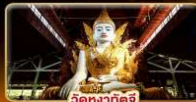
วัดหงาทัตจี