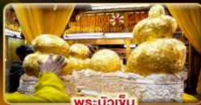
พระบิวเจิม