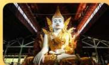
วัดหงากัดจี