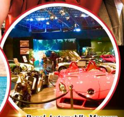
Royal Automobile Museum