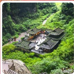
หลุมบ่อฟ้า