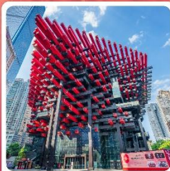
ตึกตะเกียบ