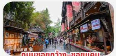
ถนนชอยกว้าง-ชอยแคบ