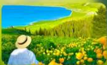
ทะเลสาบไซท์หลี่มู่