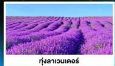
ทุ่งลาเวนเดอร์