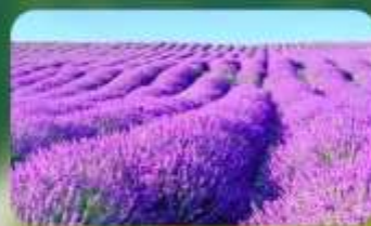
ทุ่งลาเวนเดอร์