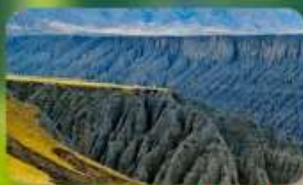
แกรนด์แคนยอนคูซานจื่อ