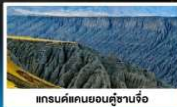
แกรนด์แคนยอนคู่ซานจื่อ