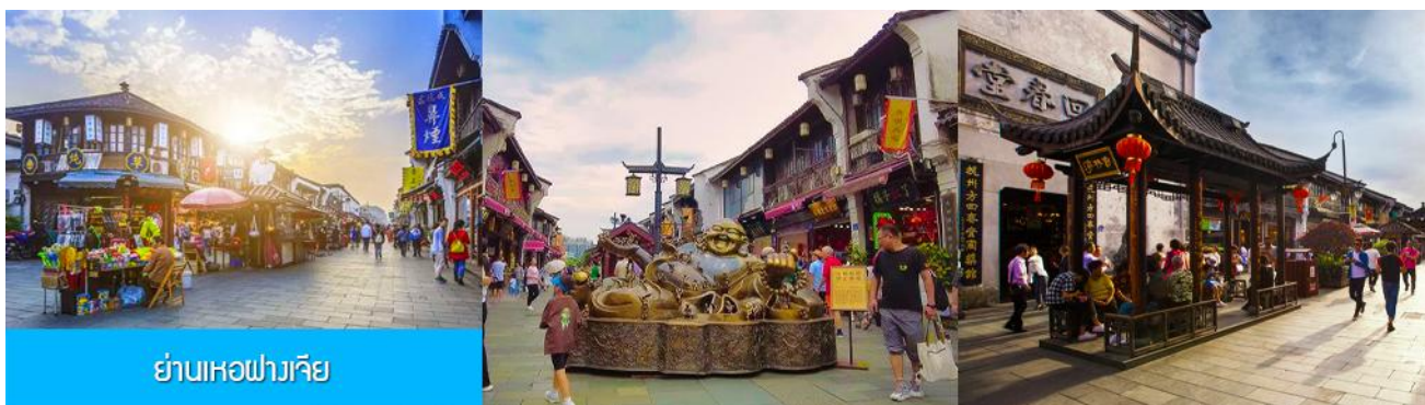
ย่านเหอฝางเจีย