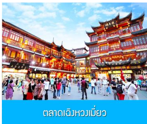
ตลาดเจิงหวงเมี่ยว

เช้า รับประทานอาหารเช้า ณ ห้องอาหารของโรงแรม (6)