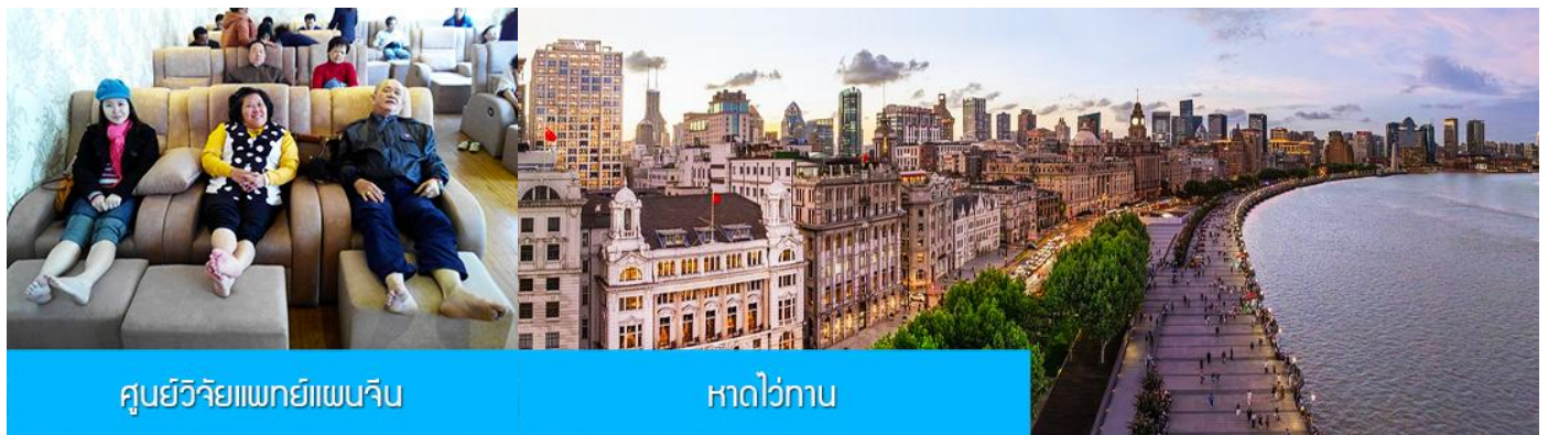
ศูนย์วิจัยแพทย์แผนจีน