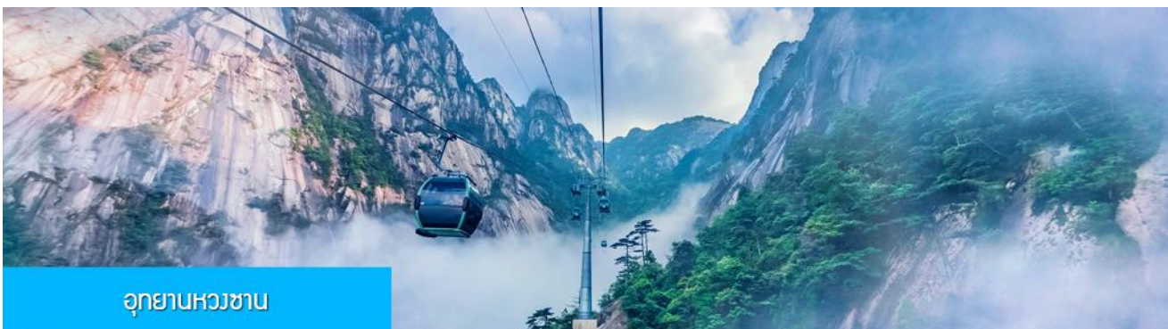
อุทยานหวงซาน