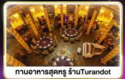
กานอาหารสุดหรู ร้านTurandot