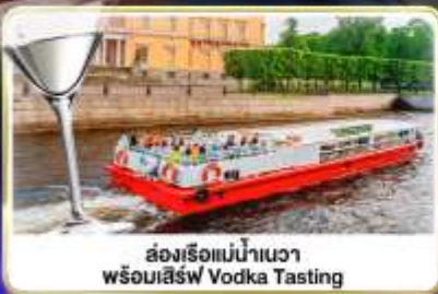
ล่องเรือแม่น้ำเนวา พร้อมเสิร์ฟ Vodka Tasting