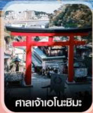
ศาลเจ้าเอโนะชิมะ