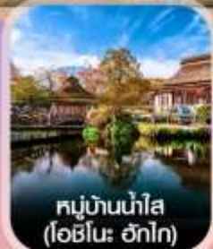
หมู่บ้านน้ำใส (ไอชิโนะ ฮักไก)