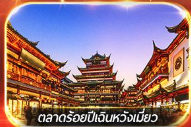
ตลาดร้อยปีเงินหวังเมี่ยว

เช็คอินหาดไว่ทาน ถ่ายรูปมุมฮิต หอไข่มุก + ตึกยุโรป (เดอะบันด์) บอพรแก๊งวัดพระหยกขาว ซุปบึงจู่ใจ ถนนนานกิง, ตลาดใต้รุ่งอุ๋หลิน