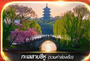
ทะเลสาบซีหู (รวมค่าล่องเรือ)