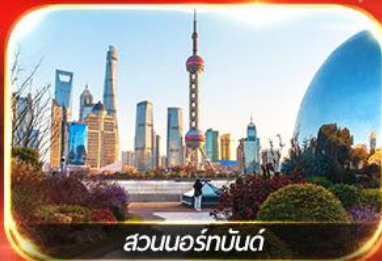
สวนนอร์มัลด์