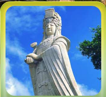
“เจ้าแม่กิมทิมหม่าโจ้ว”

เที่ยวเซี่ยะเหมิน เมืองท่าชายฝั่งทะเล • บ้านดินตุ๋โหลว • ชมการแสดงชาวฮักกา เมืองโบราณฉวนโจ้ว • วัดโคหยวน • เจ้าแม่กิมทิมหม่าโจ้ว • โชว์ตำนานแห่งฉู่เจี้ยนใต้ เกาะกู่ลิ่งอวี • ถนนคนเดินหลงโถวหลู่ • วัดหนานฝูโกว • ย่านศิลปะซาโป่วย