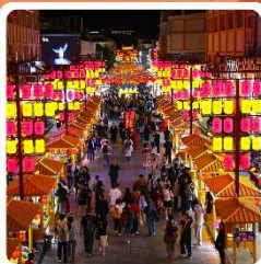
ตลาดกลางคินซาโจว