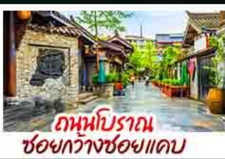
ถนนโบราณ ช่องกวางช่องแคบ