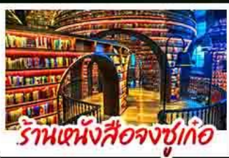
ร้านหนังสือจงชู่เก้อ