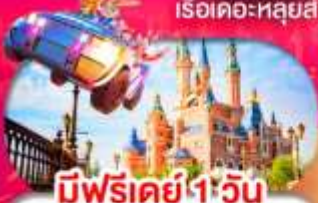
มีฟรีเคย์ 1 วัน