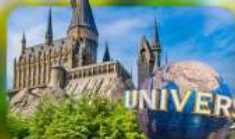
เลือกอิสระ: Universal Studios Japan

HOTEL TETORA KYOTO EKIMAE หรือเทียบเท่ามาตรฐานญี่ปุ่น IZUMINO CENTER HOTEL หรือเทียบเท่ามาตรฐานญี่ปุ่น IZUMINO CENTER HOTEL หรือเทียบเท่ามาตรฐานญี่ปุ่น