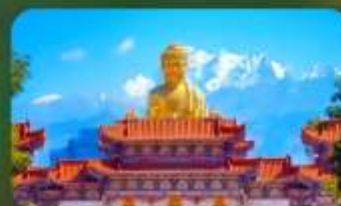
วัดพระใหญ่หรงกวงซาน