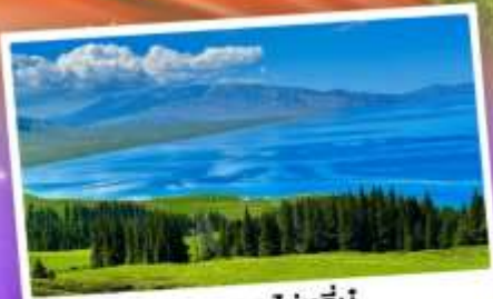
ทะเลสาบโซหลี่มู่

เที่ยวทุ่งหญ้าคองฝ้านาราตี ชมความสวยงามทะเลสาบโซหลี่มู่