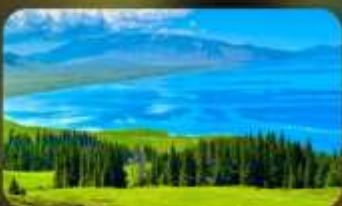
ทะเลสาบโซหลี่มู่