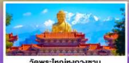
วัดพระใหญ่ทงกวงชาน