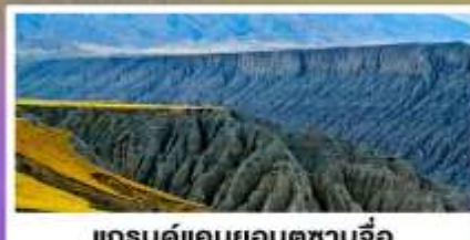
แกรนด์แคนยอนตูซานจื่อ