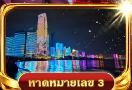
หาดหมายเลข 3