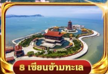
8 เซียนข้ามทะเล