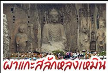
ผาแกะสลักหลงเหมิน

เที่ยวครบ 4 มรดกโลก ถ้ำหลงเหมิน - สุสานฉินซีฮ่องเต้ - วัดเส้าหลิน หมู่บ้านไต้ดินसानโจว - หมู่บ้านกัวเลียงซุน