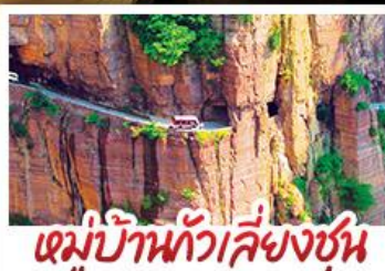
หมู่บ้านกัวเลียงซุน