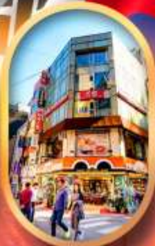
ช้อปปิ้งย่านเมียงดง