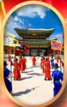
พระราชวังเคียงบก