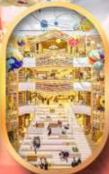
ห้องสมุดสตาร์ฟิลด์