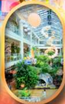
Forest Outing Cafe