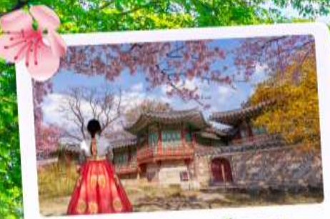
พระราชวังชางด็อกกุง