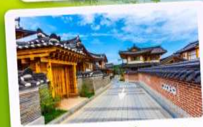
หมู่บ้านโบราณอินพยอง