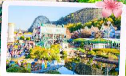
เอเวอร์แลนด์

ชม หอคอยเอ็นโซลทาวเวอร์ สัญลักษณ์กรุงโซล