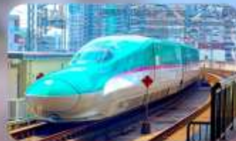
นั่งรถไฟชินคันเซ็น