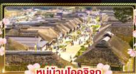
หมู่บ้านโออิจิคุ