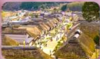
หมู่บ้านโออูจิจุกุ