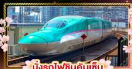
นั่งรถไฟชินคันเซ็น