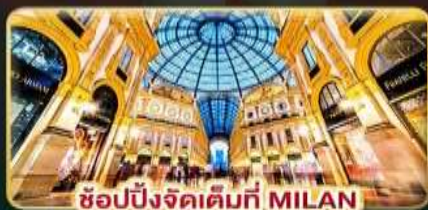
ช้อปปิ้งจัดเต็มที MILAN

ดินแดนแห่งธรรมชาติ กับเวลาที่ให้ท่านได้พักผ่อนอย่างเต็มที่