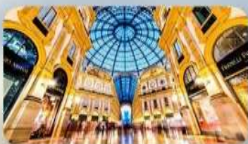
ช้อปปิ้งจัดเต็มที MILAN