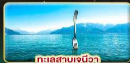
ทะเลสาบเจนีวา