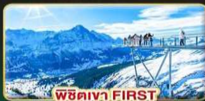
พีชิตเขา FIRST