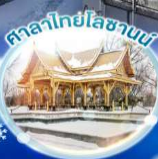
ศาลาไทยโบราณ