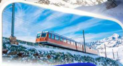
ขบวนรถไฟฟันเฟืองก่อนนอร์แอด