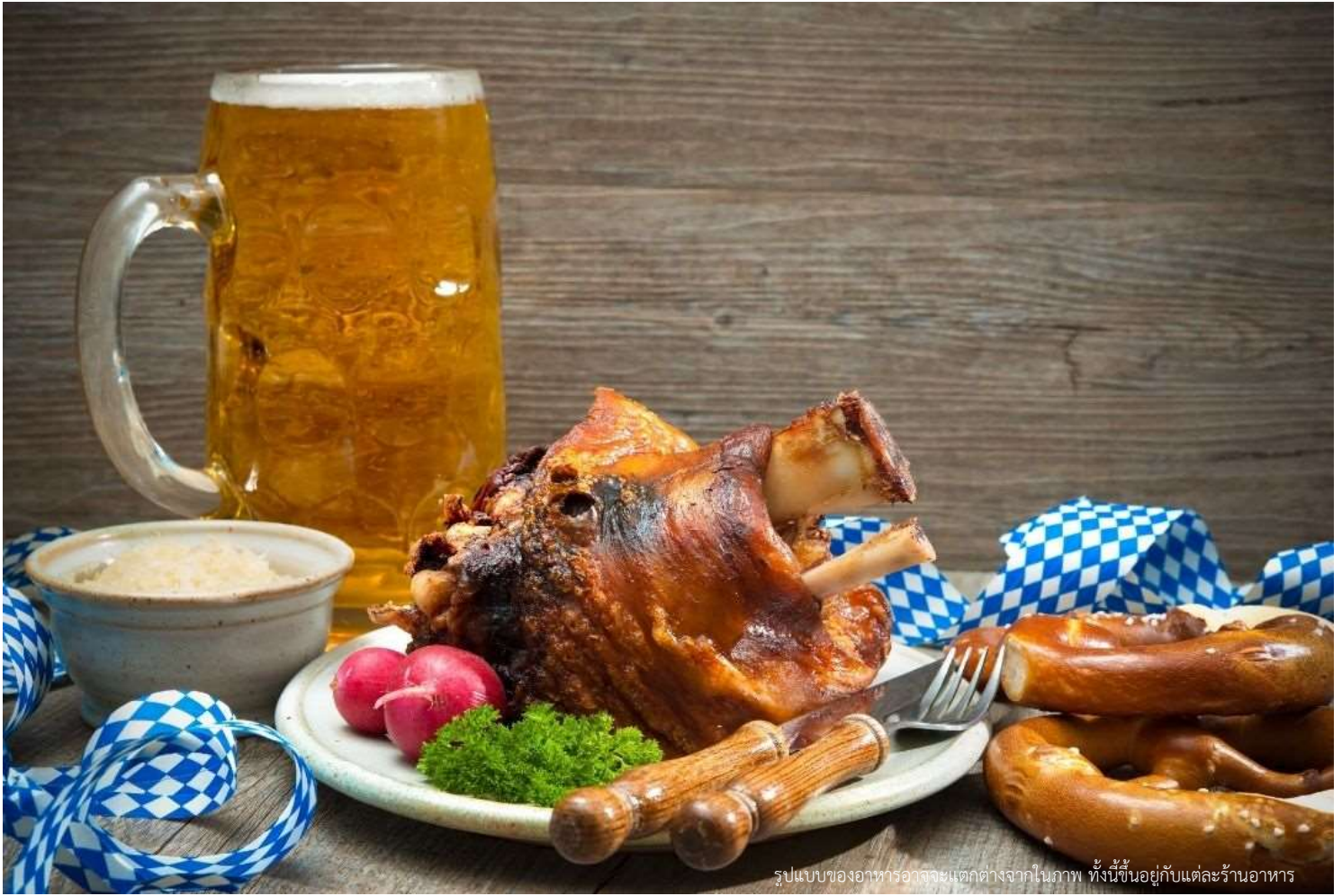
รูปแบบของอาหารอาจจะแตกต่างจากในภาพ ทั้งนี้ขึ้นอยู่กับแต่ละร้านอาหาร

วันที่สาม การ์มิสซ์ ปาร์เทินไครเชิน-ยอดเขาซุกสปิตเซ่-เมืองซาลบูร์ก