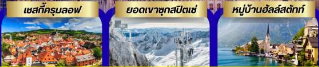
เชสกีครุมลอฟ