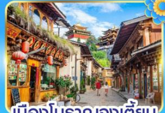
เมืองโบราณจงเตี้ยน