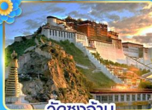
วัดชงจ้าน