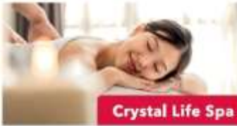
Crystal Life Spa