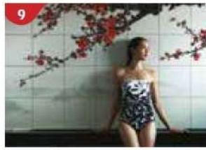
9 Crystal Life™ Spa Rejuvenate mind, body and soul with our holistic Western and Asian spa experience.