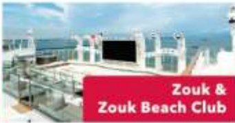
Zouk & Zouk Beach Club