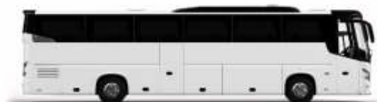
ตัวอย่างรูปภาพรถ 1 ชั้น

หากประเภทห้องที่ท่านริเวศมาเต็ม อาทิ เช่น ริเวศห้องพักเป็น TWIN BED หรือ DOUBLE BED ทางบริษัทของสงวนสิทธิ์ในการปรับประเภทห้องพัก เป็น ตามที่โรงแรมมีอยู่ โดยไม่ต้องแจ้งให้ทราบล่วงหน้า