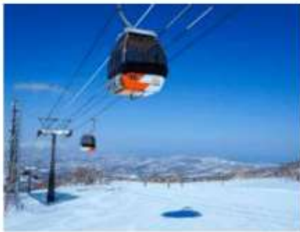
KIRORO SKI RESORT

หลังรับประทานอาหารเช้า อิสระให้ท่านเล่นกิจกรรม ณ ลานสกี KIRORO SKI RESORT ตามอัธยาศัย (**ไม่รวมค่าเช่าชุดกันหนาว และอุปกรณ์เครื่องเล่น) ที่มีอุปกรณ์ทุกอย่างที่จำเป็นสำหรับการเล่นสกีให้ท่านไม่ว่าจะเป็นเสื้อผ้า, รองเท้า, หมวก, แว่น, และถุงมือ ทุกขนาดสำหรับทุกเพศและทุกวัย ด้วยขนาดใหญ่หลายร้อยเอเคอร์มีลู่วิ่งสกีมากถึง 22 ลู่วิ่ง และบริเวณสวนที่กว้างรวมถึงมีพื้นที่สำหรับเล่นสกีนอกลู่วิ่ง (Off-Piste) ขนาดใหญ่ทำให้ไม่ต้องรอดิวเล่นสกีนาน หรือจะไปที่สถานี Gondola/Chair Lift (ไม่รวมค่ากระเช้า) ที่อยู่ด้านข้างโรงแรมเพื่อไปยังยอดเขาต้นบน เพื่อไป สังสรรค์แห่งความรัก Nisa Bell หรือ Lover's Bell ระฆังชื่อดังของยอดเขา Asari หมายเหตุ การเปิดให้บริการของกอนโดล่าขึ้นอยู่กับกำหนดการเปิดปิดของลานสกีและสภาพอากาศ ณ วันเดินทาง