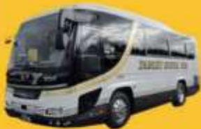
Bus (10-20 ท่าน)

➔ สำหรับท่านที่ต้องการความเป็นส่วนตัวมากขึ้น ท่านสามารถเลือกใช้บริการ รถส่วนตัวได้โดยมีรูปแบบรถให้เลือกถึง 3 ประเภท โดยรถ แต่ละประเภทสามารถนั่งได้ตั้งแต่ 2 ท่านขึ้นไป