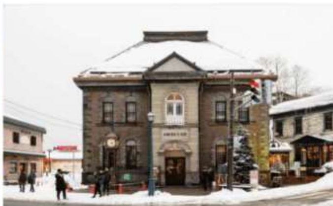
OTARU MUSIC BOX MUSEUM