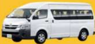
VAN (2-8 ท่าน)