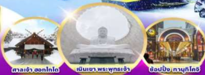
ศาลเจ้า ฮอกไกโด