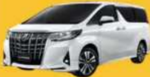
Alphard (2-4 ท่าน)