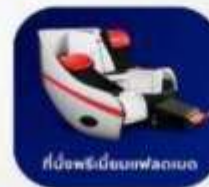
ที่นั่งพรีเมียมเฟลอร์เบด