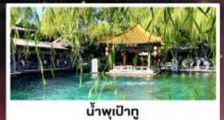
น้ำพุเป่ากู่