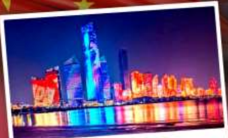
No.3 Bathing Beach