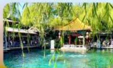
น้ำพุเปาตู