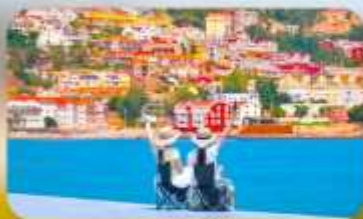
หมู่บ้านชาวประมงซาจื่อโงว