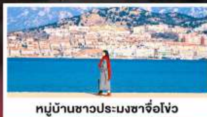
หมู่บ้านชาวประมงซาจี๋อว่