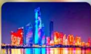
No.3 Bathing Beach