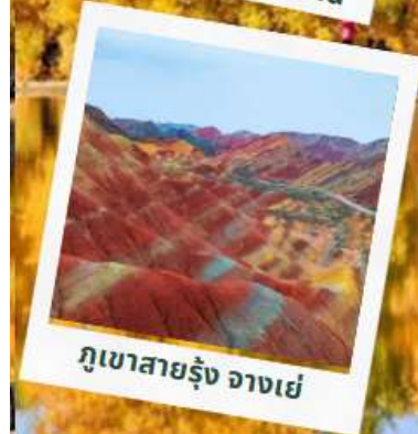
ภูเขาสายรุ้ง จางเย่