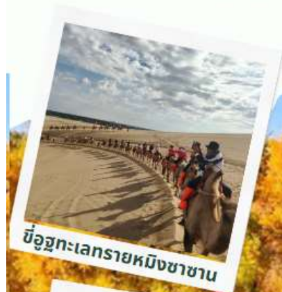
ขี่อูฐทะเลทรายหมิงซาซาน

ชมป่าเปลี่ยนสี ป่าหุบเขาหลังจิงถ่า พิเศษ++ไม่ต้องลากกระเป๋าขึ้นรถไฟ