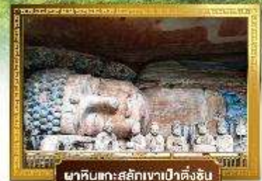
สลักหินแกะสลักเขาเป่าต้งซัน