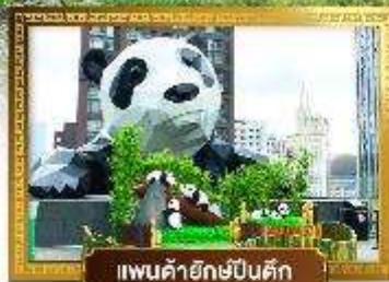
แพนด้ายักษ์ปิ่นตึก